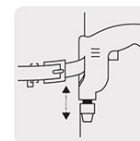
Clip para cinturón