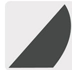
Acabado negro mate