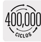
Cierre y apertura