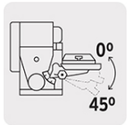
Posiciones de mesa de trabajo