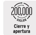
Cierre y apertura