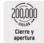
Cierre y apertura