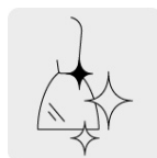
Pulido espejo para fácil limpieza