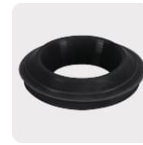
Empaque antifuga con diseño cónico