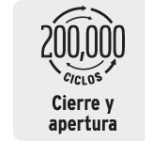
Cierre y apertura