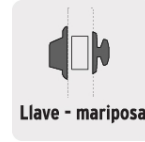
Llave - Mariposa