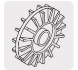
Impulsor de nylon