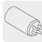
Capacitor para mayor potencia al arranque