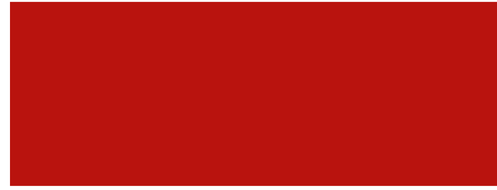
ROJO BERMELLÓN 0009