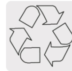
El cobre es un material reciclable