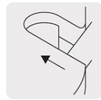
Cavidad para cortar fleje