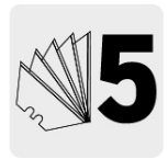
Incluye navajas de acero 103Cr3