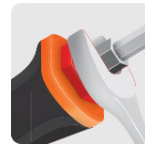
Hexágono en la barra maximiza el torque con llave