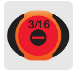
Marcado y código de color para fácil identificación de medida y punta