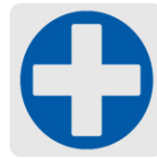
Punta de cruz