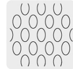
Malla al reverso