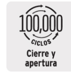
Cierre y apertura