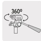
Base con giro horizontal