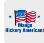
Mango Hickory Americano