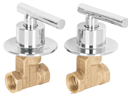
Conexiones roscables 1/2" - 14 NPT