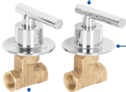
Cuerpos de bronce