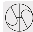
Punta Split Point