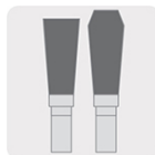
Dientes alternos tipo trapecio y plano