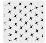
Tejido de punto en bolsas