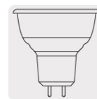
Lámpara MR 16