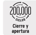
Cierre y apertura