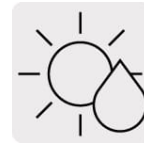
Corte en seco o en húmedo