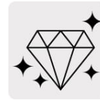
Banda de diamante