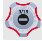
Marcado y código de color para fácil identificación de medida y punta